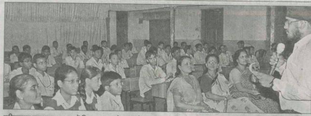
एडीएलएस सनशाइन स्कूल में विक्ज मास्टर के सवालों का जवाब देते छात्र