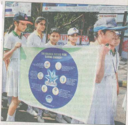
Students of ADLS Sunshine School take part in an energy conservation rally in Jamshedpur on Tuesday. (Bhola Prasad)