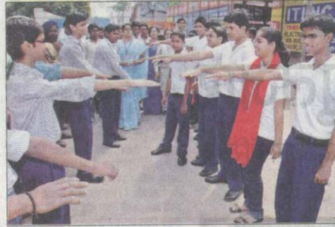
ऊर्जा संरक्षण का संकल्प लेते एडीएलएस सनशाइन के छात्र-छात्राएं जागरण