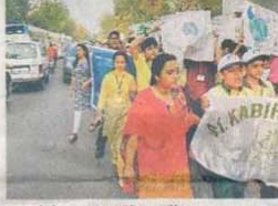
Participants at the rally